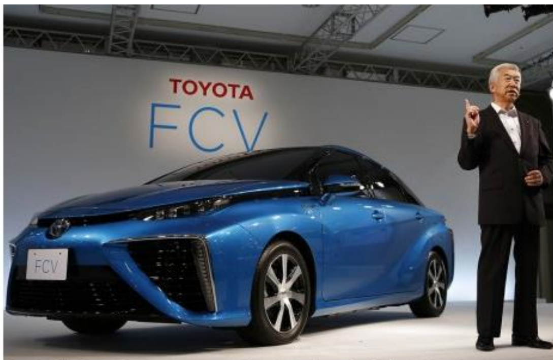
Toyota FCV fotograferet under præsentationen i den japanske bilgigants hovedsæde.

tirsdag d. 14. okt. 2014 kl. 21:06 | af: Morten Nielsen, mori@tv2.dk