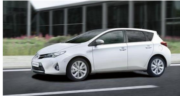
Toyota Auris Hybrid