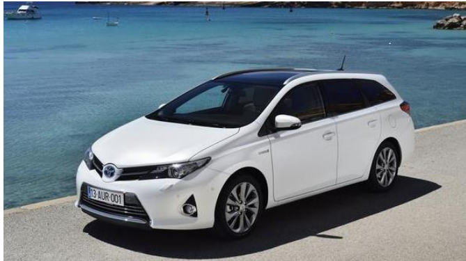
Toyota Auris Turing Sports Hybrid