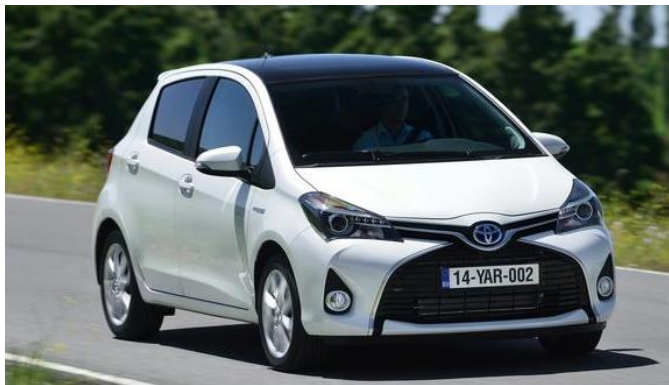
Toyota Yaris Hybrid