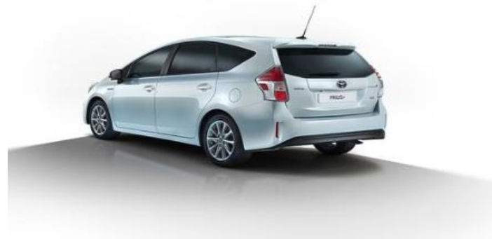
Toyota Prius +